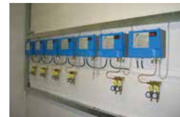
DLR-G, Paesi Bassi