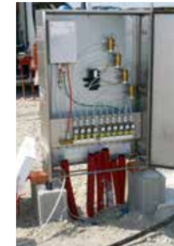
VLX 330/A-Ex, Nuova Zelanda