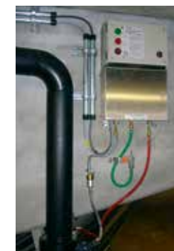
VLX 330, Ungheria