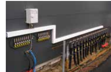
VLX 330/A-Ex, Austria