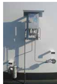
VLX 330/A-Ex, Oman