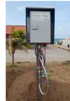
VLX 330/A-Ex, Aruba