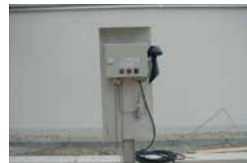
VLX 330 Ex, Polonia