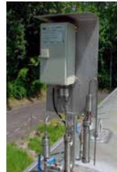
VLX 330/A-Ex, Francia