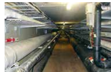
VLX 330, Inghilterra